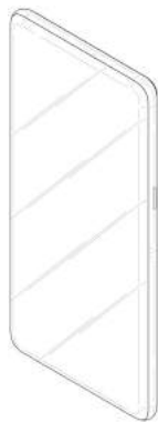
设计2示出表面轮廓及透明部参考图1