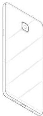
设计2示出表面轮廓及透明部参考图2