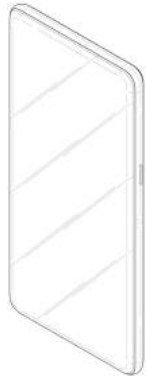
设计1示出表面轮廓及透明部参考图1