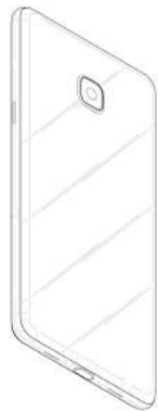
设计1示出表面轮廓及透明部参考图2